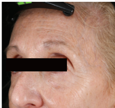
ЧЕРЕЗ 30 ДНЕЙ