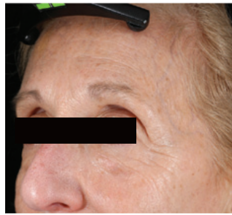
ЧЕРЕЗ 2 ДНЯ