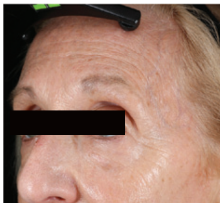
ЧЕРЕЗ 7 ДНЕЙ