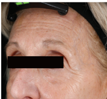
ЧЕРЕЗ 4 ЧАСА