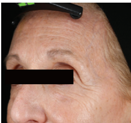
ДО НАЧАЛА ИССЛЕДОВАНИЯ

ДО НАЧАЛА ИССЛЕДОВАНИЯ | ЧЕРЕЗ 4 ЧАСА | ЧЕРЕЗ 2 ДНЯ | ЧЕРЕЗ 7 ДНЕЙ | ЧЕРЕЗ 30 ДНЕЙ